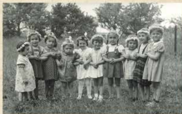
Mädchengruppe im Garten, 1958

Wer hat Fotos aus seiner Kindergarten-Zeit für die Topothek? Bitte melden Sie sich bei uns. Vielen Dank.