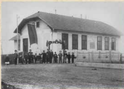
Eröffnung am 20. November 1904