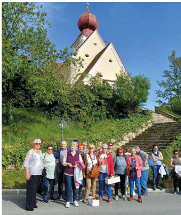
Am 28.4.24 fuhren die Pensionisten Weigelsdorf mit den Pensionisten Unterwaltersdorf nach Puch bei Weiz zum Apfelblütenfest. Bei schönem Wetter verlebten wir einen schönen Tag.

www.ebreichsdorf.gv.at Ihre Stadt im Internet