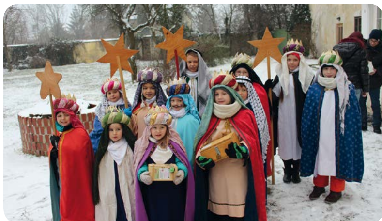
Auch heuer waren wieder viele Sternsinger-Kinder in unseren Ortsteilen unterwegs, um Segenswünsche für das neue Jahr zu überbringen.