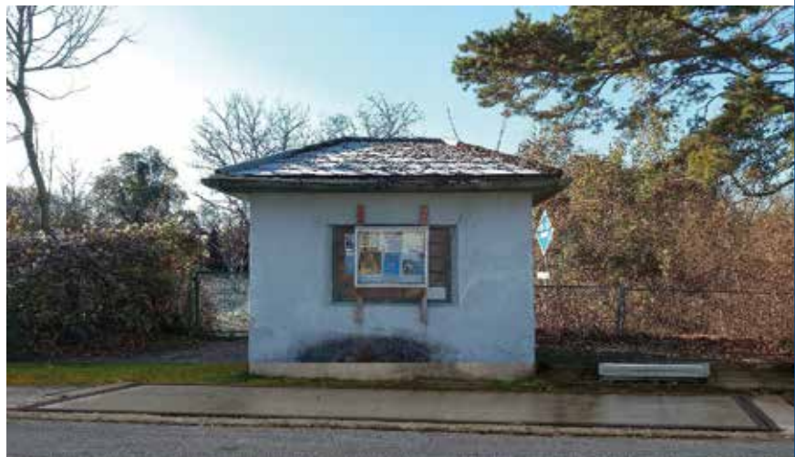
Fotomontage Waagenhaus Unterwaltersdorf

Ein im Web gefundenes Foto einer Schember-Brückenwaage zeigt ein sehr ähnliches Waagenhaus. In einer Fotomontage haben wir die Waagenplattform unseres Häuschens rekonstruiert, sodass man sich das ursprüngliche Aussehen vorstellen kann.