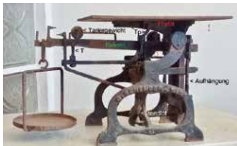
Schember-Dezimalwaage aus dem Heimatmuseum

Bei der Archivierung dieser Dezimalwaage sind wir auf die Wiener Firma Schember gestoßen, die vorwiegend Brückenwaagen für den Bahnbereich herstellte.