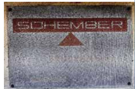
Typenschild Brückenwaage Ebreichsdorf

Laut Bahnhofschronik von Wampersdorf wurde am 23.7.1908 in Unter-Waltersdorf eine Straßenbrückenwaage gebaut. Das Waagenhäuschen befindet sich noch vor unserem Museum.