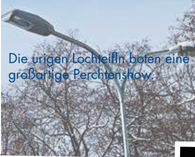
Die uralten Lochreifln boten eine großartige Perchtenshow.