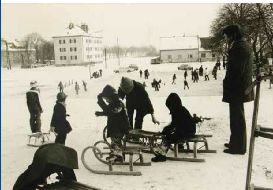
Winterfreuden, ca. 1965.

Auch auf der „Gubawiese“ in der Boschan konnte man eislaufen. Dafür wurde von der Gemeinde ein asphaltierter Platz errichtet. Das Wasser für den Eislaufplatz kam vom Gasthaus Ahorn.