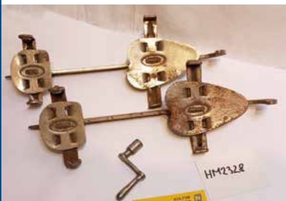
Schraubendampfer aus dem Museumsarchiv