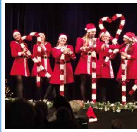
Auf der Bühne war beim Ebreichsdorfer Adventzauber immer etwas los. Solisten und Gruppen sorgten für Abwechslung