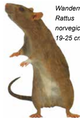
Wanderratte Rattus norvegicus 19-25 cm